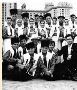
Гагауз адамлык Как Молдова стала общим домом для разных народов. Часть вторая