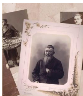
Как Молдова стала общим домом для разных народов Часть первая. Еврейское местечко

Спецпроект Newsmaker.md о том, как на территории нынешней Молдовы появились и жили представители разных национальностей, и какой вклад они внесли в историю и культуру страны: Как Молдова стала общим домом для разных народов. http://newsmaker.md/rus/novosti/armyanskoe-podvoren-kak-moldova-stala-obshchim-domom-dlya-raznyh-narodov-chast-pyat-39348 Первые материалы цикла были посвящены армянам, евреям, гагаузам, украинцам и полякам.