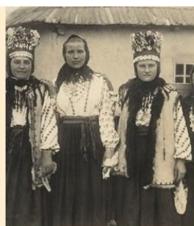
Украинская хатчина Как Молдова стала общим домом для разных народов. Часть третья