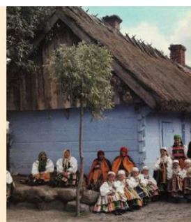
Dom Polski Как Молдова стала общим домом для разных народов. Часть четвертая