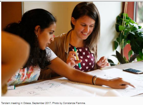
Tandem meeting in Odesa, September 2017.

https://www.culturalfoundation.eu/european-cultural-challenge-2018/